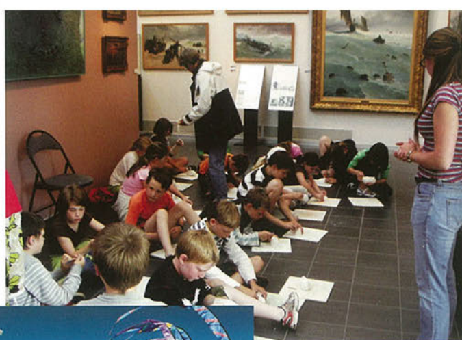
Honnefer Schüler im Bercker Museum